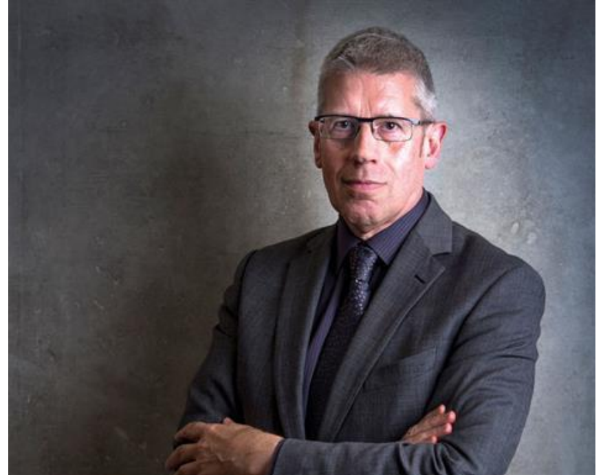
Cliff Prior , CEO de Big Society Capital

Fondo de fondos público-privado con 900 millones de libras bajo gestión para la inversión en impacto social.